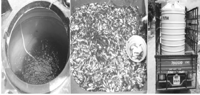
«AAEPPIAIAEAB EvbE PPIUuUE °EAO 1ZAUa